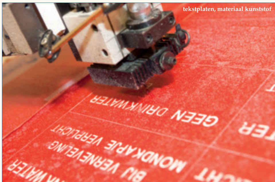
tekstplaten, materiaal kunststof

we merken dat er iets niet klopt – bijvoorbeeld in de tekst of uitvoering – dan trekken we meteen aan de bel. Samen proberen we tot het beste resultaat te komen. Dat merken klanten ook; dat je bereid bent een stap meer voor ze te zetten. Voorop staat het doel dat de klant tevreden is met het geleverde product.'