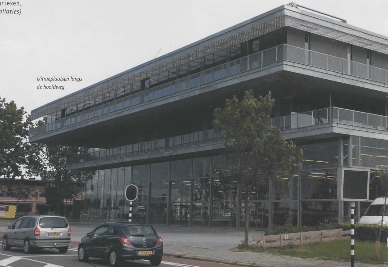
Uitrukplaatsen langs de hoofdweg

De kazerne verrijst op de hoek van de Gerenweg en de Marsweg, op het industrieterrein Marslanden in Zwolle. Over vier bouwlagen (17 meter hoog) is een