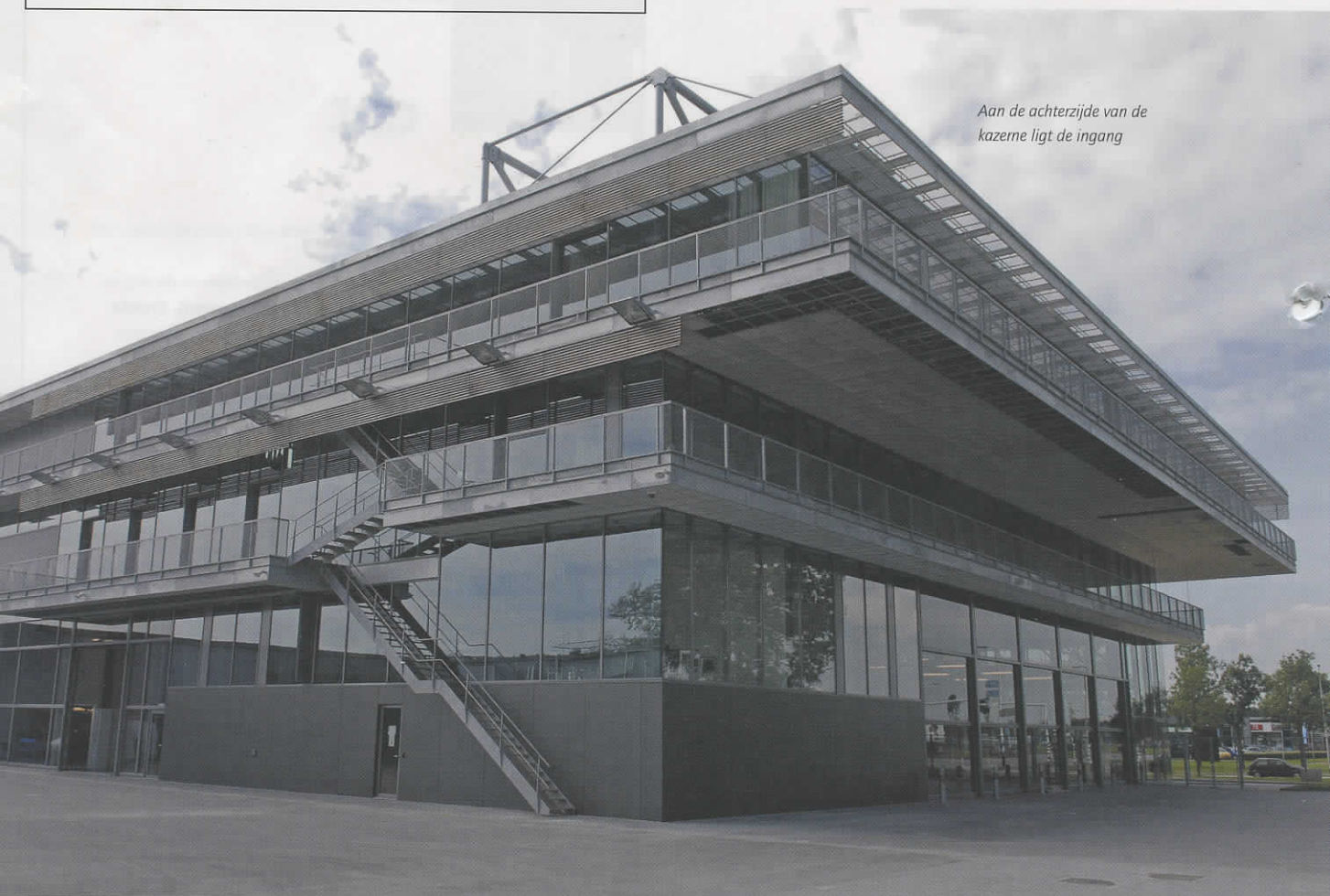
Aan de achterzijde van de kazerne ligt de ingang

Achter de nieuwbouw is een oefentoren geplaatst, met bovenin een nagebouwde woning. De oefenfaciliteit wordt gebruikt door politie- en brandweerkorpsen uit de regio. Kunstenaar Geert Mul ontwerpt het kunstwerk dat bij de kazerne wordt geplaatst. Met de ingebruikname van de nieuwe hoofdpost is Zwolle uit de brand. In de Hanzestad bevinden zich nu op twee plaatsen kazernes, die 24 uur per dag bemand zijn. De andere post in Zwolle-Zuid werd al in 1989 ook door Trebbe Bouw uitgevoerd. ■